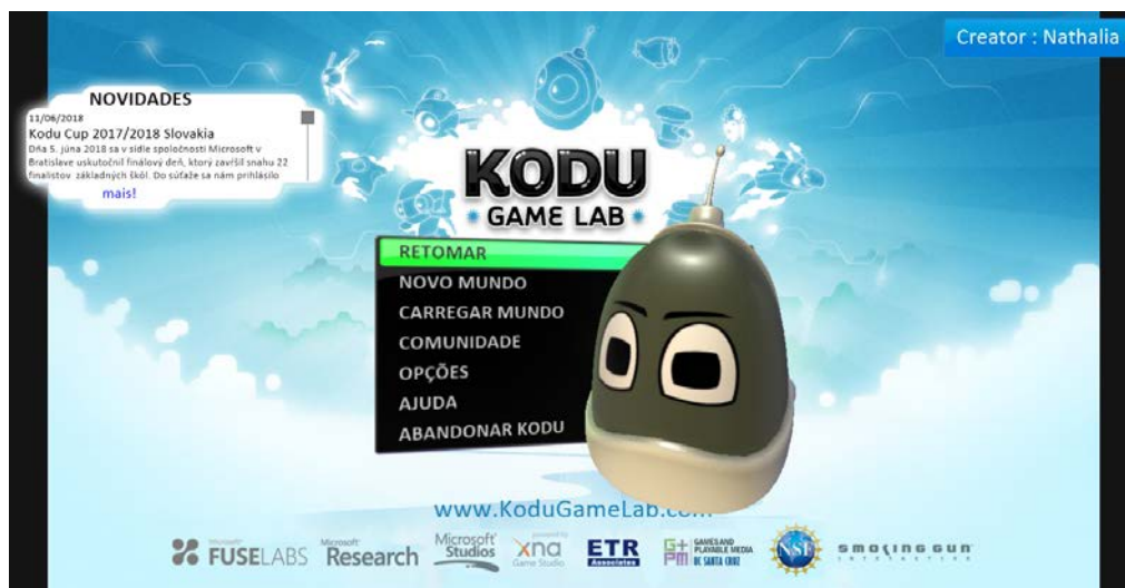
Figura 1 – Tela Inicial Kodu

Atualmente o Kodu consiste em mais de 500 blocos de regras. A gramática básica descrita por STOLEE (2010) é a seguinte: