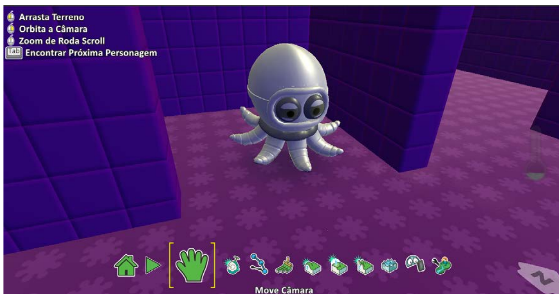
Figura 5 – Octopus

estático, porém nas demais fases ele se movimenta, e também dispara mísseis. O jogador recebe a opção de atirar, através da tecla espaço, para conseguir remover esse personagem do caminho e continuar.