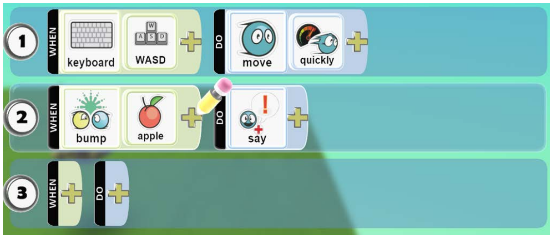
Figura 2 – Regras da linguagem Kodu

Para SHOKOUHI, ASEFI e SHEIKHI (2013) o Kodu torna a programação interessante e criativa, para o programador, ao invés de ter que escrever os códigos, é possível usar e criar os objetos. Cada personagem e objeto tem um conjunto específico de ações, comportamento e propriedade, reagindo a um conjunto de diferentes eventos (ver, bater, ouvir, mover, lançar, entre outros). O Kodu especifica condições, sequências e normas, que ensinam causa e efeito. Embora a